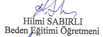
Hilmi SABIRLI Beden Eğitimi Öğretmeni